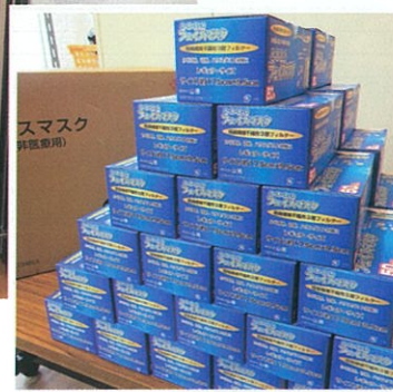
マスクの保管「防災センター」

大田市、島根県、国より、マスクの支給がありました。また補助金等で消毒液や空気清浄機の購入を致しました。コロナの終息を願っておりますが、皆さんと協力しながら感染防止対策を引き続き行っております。