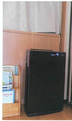
保育園内「空気清浄機」